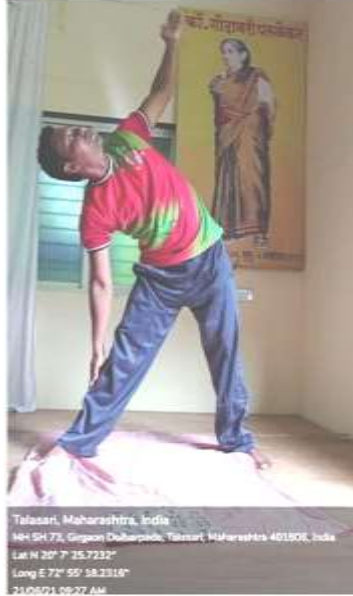
Talsari, Maharashtra, India MH SH 77, Gagan Dabarpada, Talsari, Maharashtra 401506, India Lat N 20° 7' 25.7232" Long E 72° 59' 18.2318" 21/06/21 09:27 AM

भारतीय परंपरेत योगाला विशेष महत्व आहे. संपूर्ण विश्वसमुदायाला भारतीय संस्कृतीने योगाची देणगी दिली. शरिरस्वास्थ्यासोबतच चित्तशुद्धीला अनन्यसाधारण महत्व आहे. आंतरराष्ट्रीय स्तरावर युनोने योगाचे महत्व लक्षात घेवुन हा दिवस आंतरराष्ट्रीय योग दिन म्हणुन साजरा करण्याचे ठरविले. त्याच पार्श्वभूमीवर महाविद्यालयात आंतरराष्ट्रीय योग दिनाचे आयोजन करण्यात आले होते.